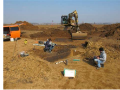
Archäologinnen und Archäologen auf einer Ausgrabung.

Rand einer Kleinstadt in Baden-Württemberg soll ein neues Wohngebiet erschlossen werden. Die Fläche, auf der die neuen Wohnhäuser gebaut werden sollen, wurde davor als Getreidefeld genutzt. Bevor die Bauarbeiten beginnen können, werdet ihr als Archäologinnen und Archäologen beauftragt die Baufläche im Rahmen einer archäologischen Ausgrabung zu untersuchen. Während Eurer Ausgrabung entdeckt ihr zahlreiche Gruben und Gräben, die zahlreiche Funde enthalten.